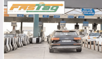
एक चालू यूपीआई ऐप रखने की सलाह भी दी गई है। यह बदलाव भारत के डिजिटल अवसरचरणा की दिशा में एक महत्वपूर्ण कदम है, जिससे राजमार्ग यात्रा तेज, सुगम और अधिक कुशल बनेगी।

को स्कैन करके यूपीआई के माध्यम से तुरंत भुगतान करने का विकल्प होगा। लेकिन अधिकारियों ने चेतावनी दी है कि नेटवर्क संबंधी समस्याओं के कारण कभी-कभी ये लेनदेन प्रभावित हो सकते हैं, जिससे देरी हो सकती है। बाधाओं से बचने के लिए, यात्रियों को सलाह दी जाती है कि वे अपनी यात्रा शुरू करने से पहले सुनिश्चित करें कि उनका फास्टैग सक्रिय है, उनके बैंक खाते से ठीक से जुड़ा हुआ है और उसमें पर्याप्त शेष राशि है। अपने स्मार्टफोन में बैंकअप के रूप में